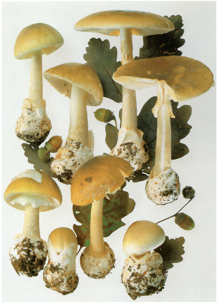
Massstab in cm