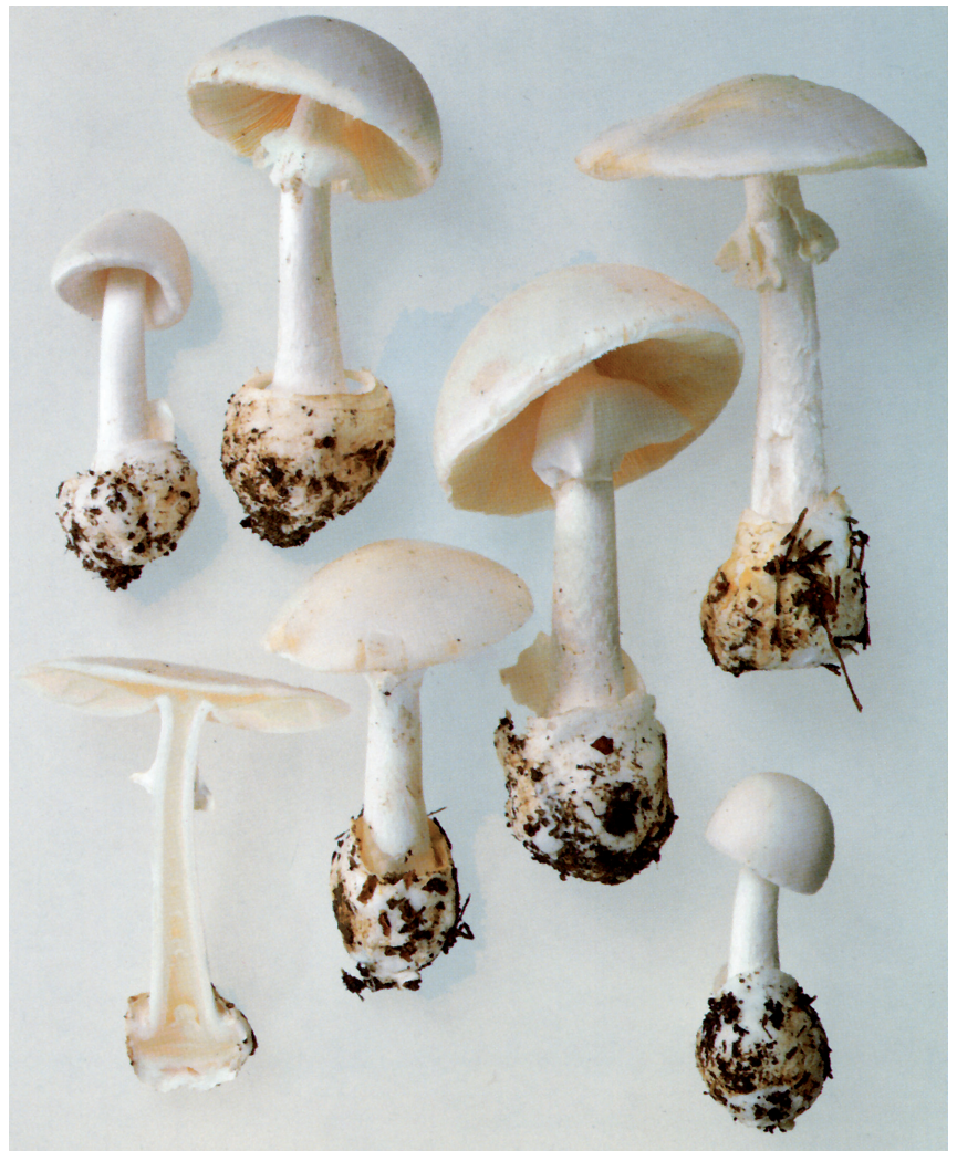
Massstab in cm