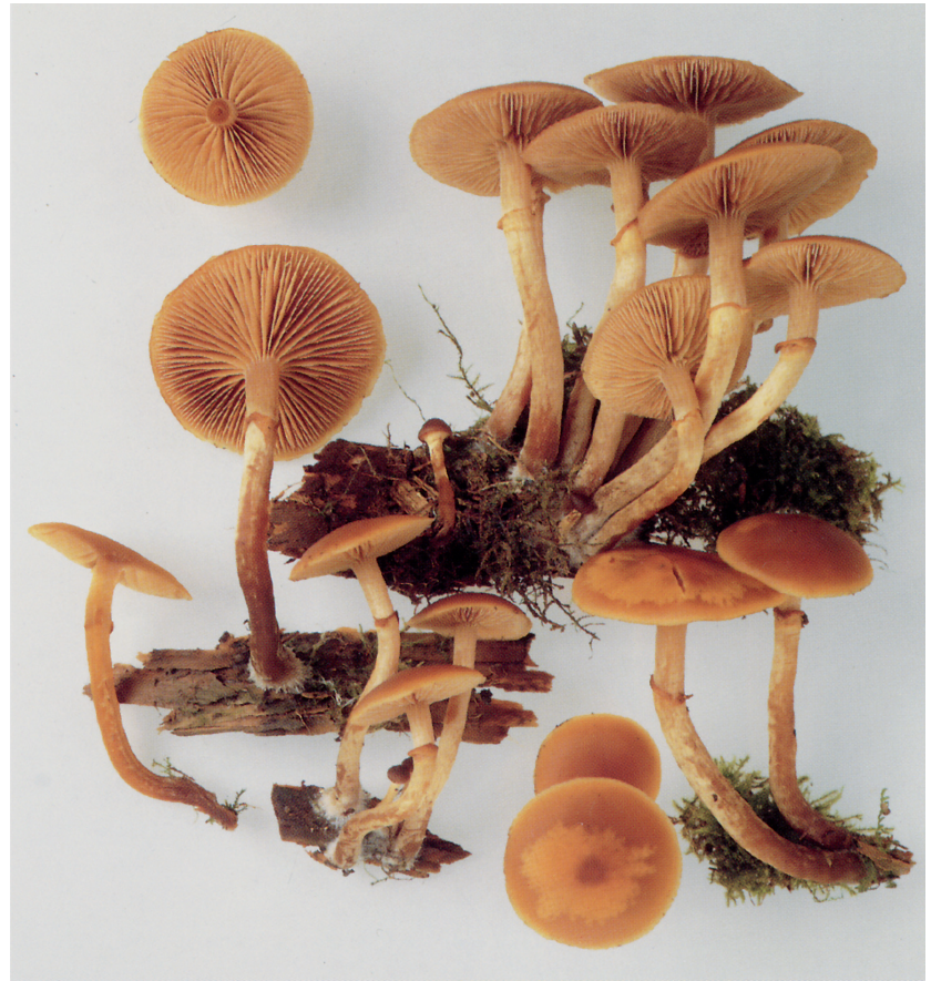
Masstab in cm