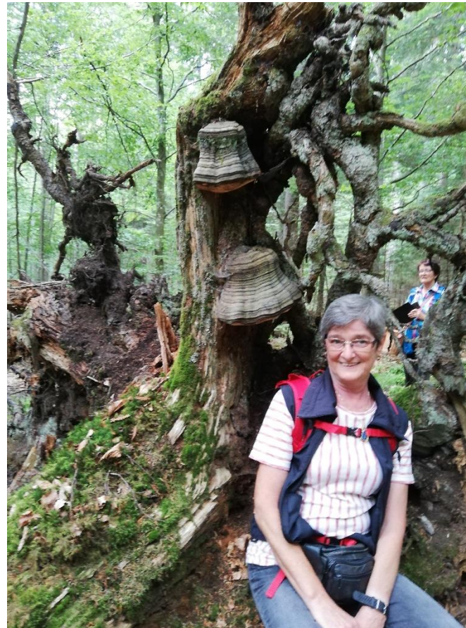
der „Glockenpilz“ Zunderschwamm