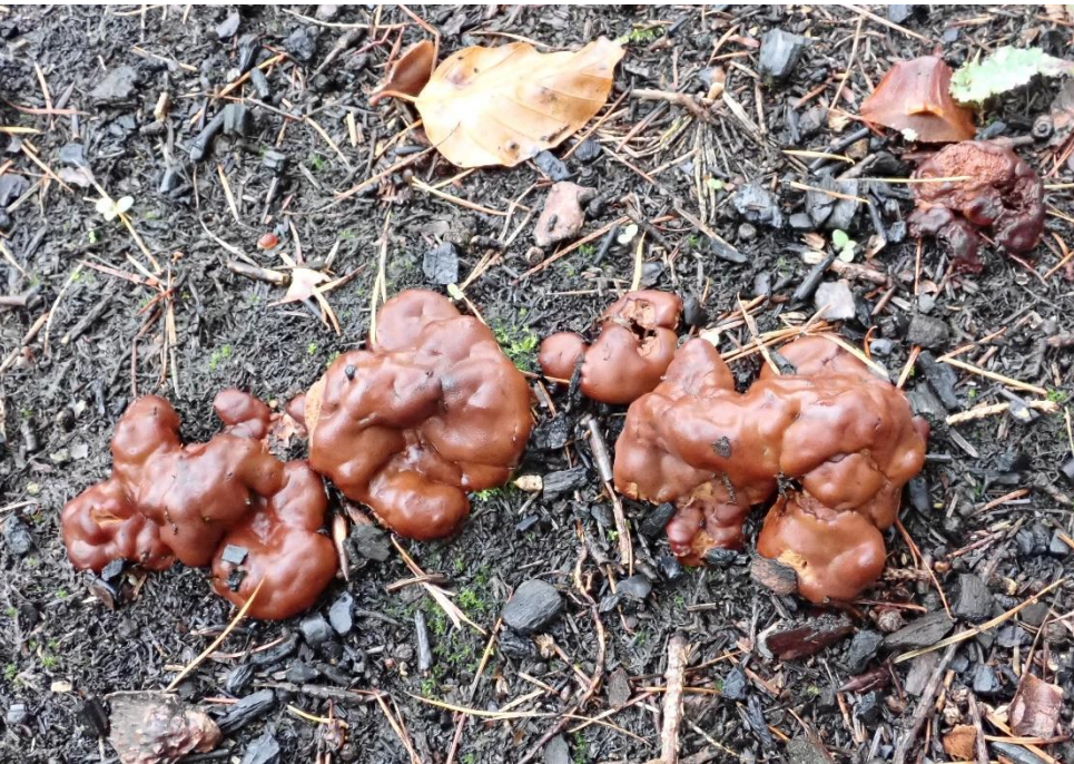
Wurzel-Lorchel ( Rhizina undulata )

Als 2. höchst interessante Exkursion ist die Begehung in Rankweil , neben dem Sportplatz Gastra im Wald v. 17. Oktober erwähnenswert.