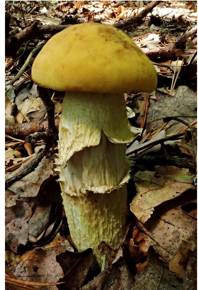
Gelber Raufußröhrling ( Leccinellum crocipodium )