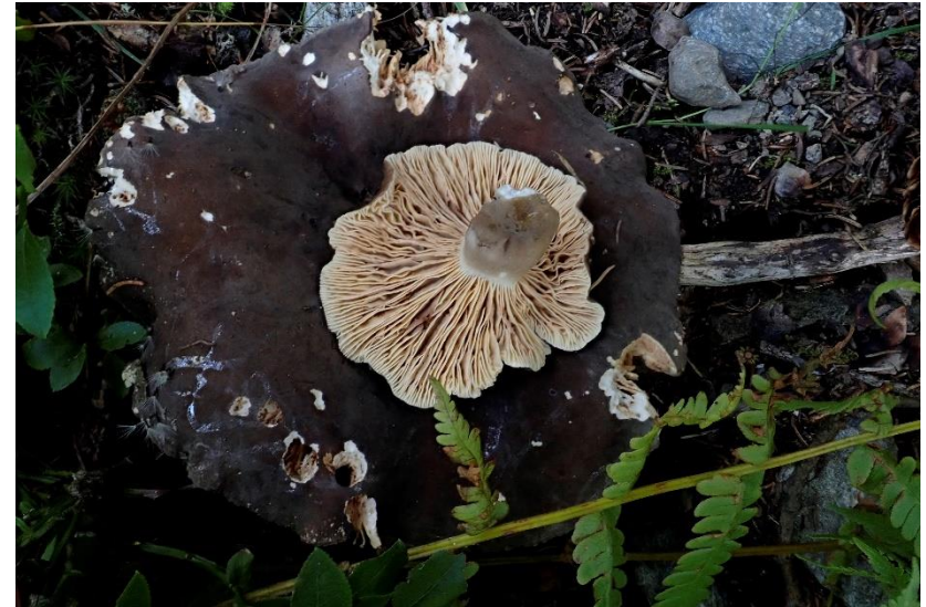
und Pechschwarzem Korallen-Milchling ( Lactarius picinus ) gefunden von Uschi in Gargellen