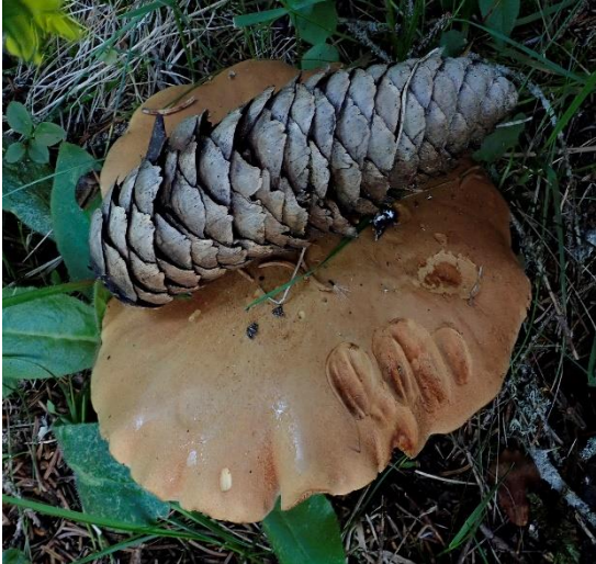
Riesenexemplare von Pfeffer-Röhrling ( Chalciporus piperatus )