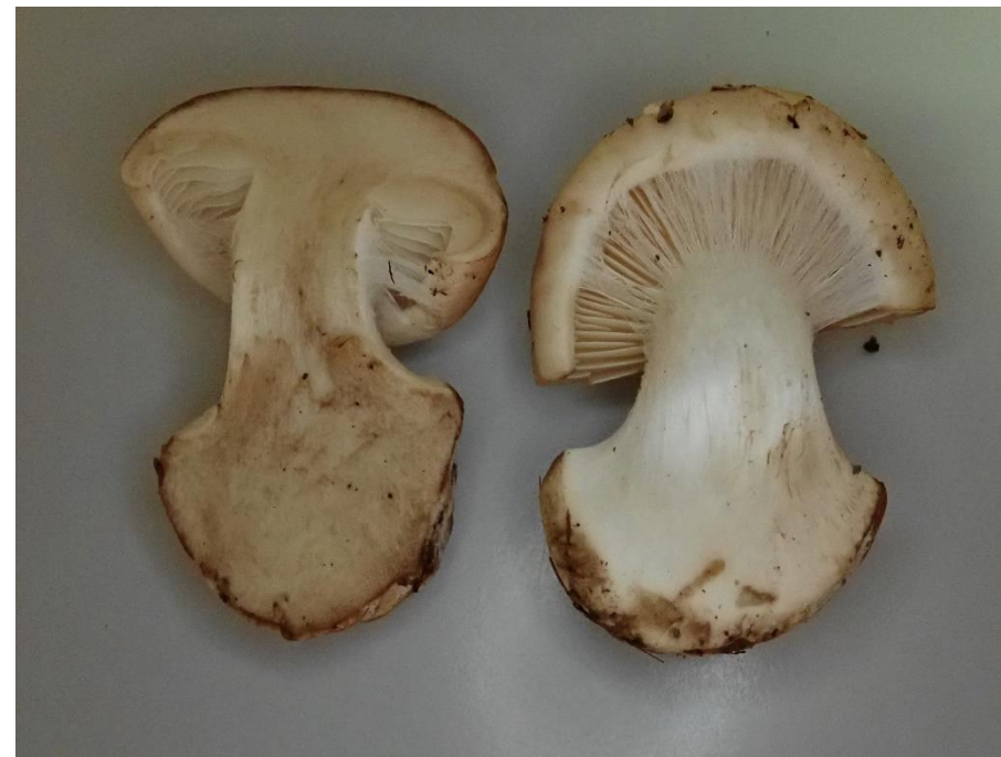
Blasssporiger Haarschleierling ( Leucocortinarius bulbiger )