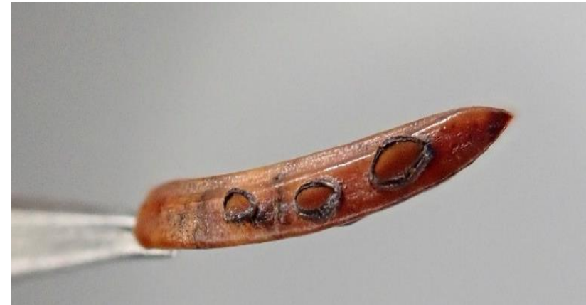
Fichtennadel-Spaltlippe einmal geöffnet