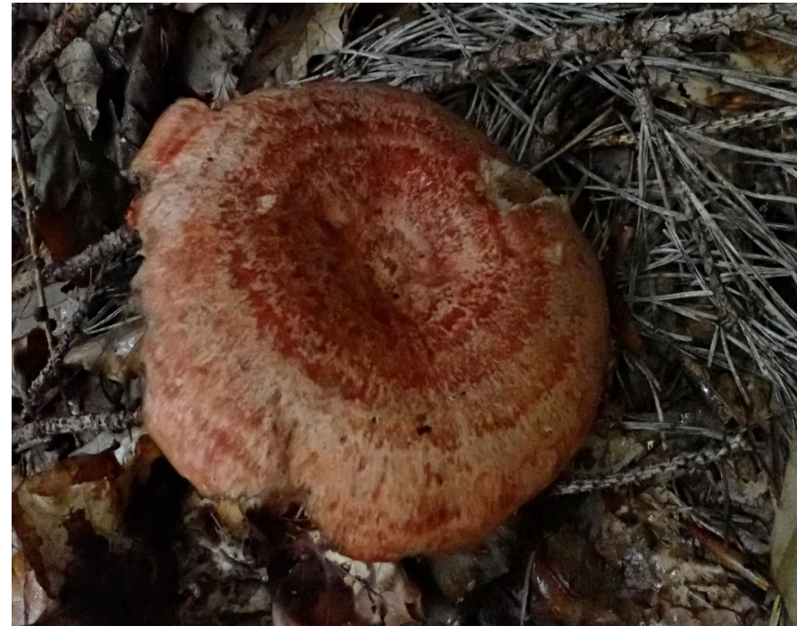
Edel-Reizker ( Lactarius deliciosus )