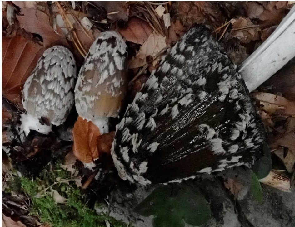
Specht-Tintling ( Coprinospicus picacea )