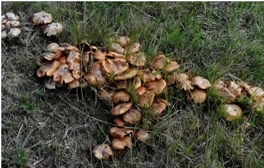
Reihiger Klumpfuss ( Cortinarius glaucopus ) gefunden von Uschi auf Alpe Almein

im Herbst 2019 gab es in Hülle und Fülle verschiedene Haarschleierlinge