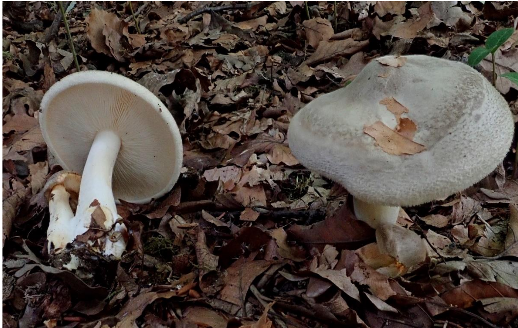
Borstiger Wiesenritterling ( Pogonoloma spinulosum )

Zwei Beispiele, die bei uns nicht zu sehen sind