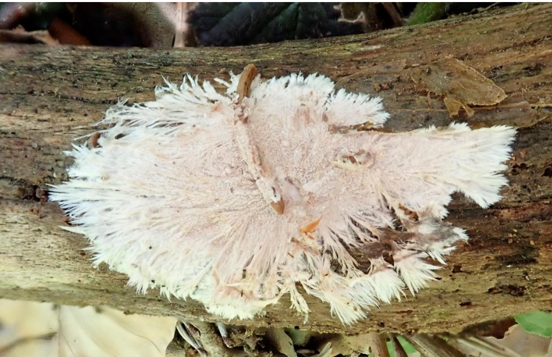
Gefranster Resupinat-Stacheling ( Steccerinum fimbriatum )

25. Mai Gaisbühel – 13 TN und 78 Arten Der Mai war größtenteils nass und kalt